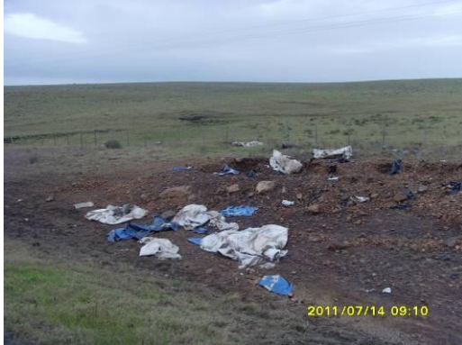
Ilustración 3 – Residuos en faja