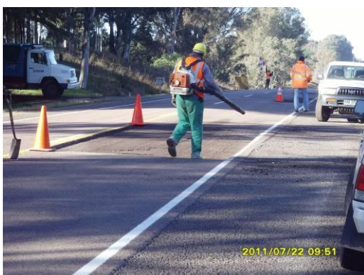
Ilustración 7: Limpiando bache con sopladora