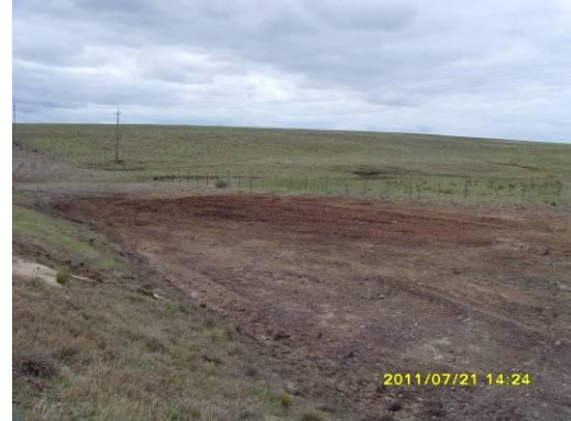
Ilustración 4 – Residuos recolectados y faja acondicionada