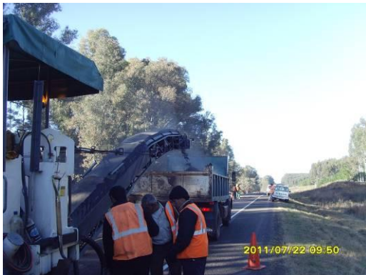
Ilustración 5: Fresado y carga del RAP