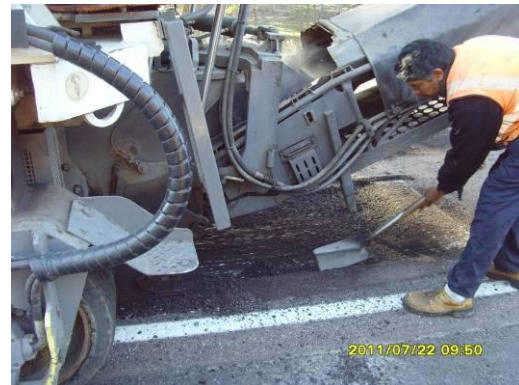
Ilustración 6: Fresadora y bache antes de poner la mezcla asfáltica