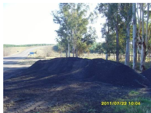
Ilustración 8: Acopio de material de fresado (RAP)