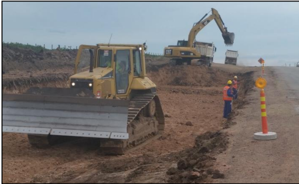
Ejecución de desmonte en faja junto a camino existente (febrero 2015).