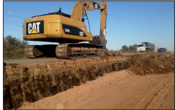
Retiro de pavimento existente, desmonte de tierra debajo del mismo y relleno en faja lateral (abril 2015).

En el período de referencia las obras fundamentalmente han consistido en las tareas concernientes a la implantación del campamento y la planta de elaboración de materiales, así como los movimientos de suelos y ejecución de capas de base y sub bases del pavimento de hormigón.