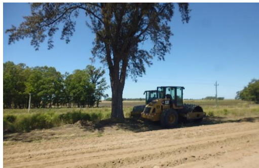
Ilustración 17 - Frente de obra. Material para nivelar y compactar..