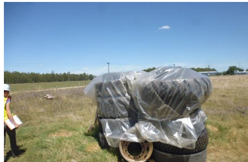
Ilustración 7 - Obrador. Acopio de cubiertas.