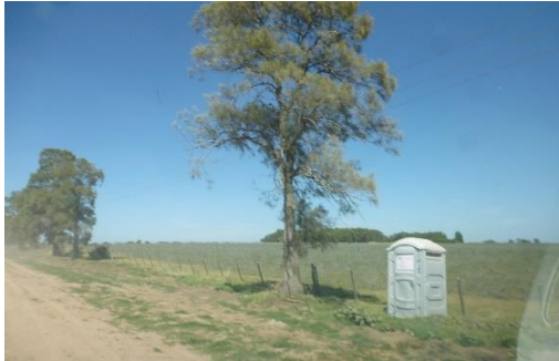
Ilustración 4 - Baño químico en faja.