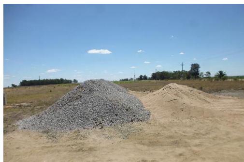
Ilustración 8 - Obrador. Acopio de material granular.