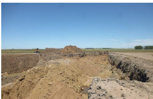
Ilustración 10 - Cantera. Padrón 178. Frente abierto.