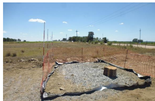
Ilustración 9 - Obrador. Sitio para camión regador de diluido asfáltico.