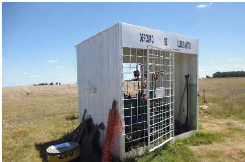
Ilustración 6 - Obrador. Acopio de aceites y lubricantes.