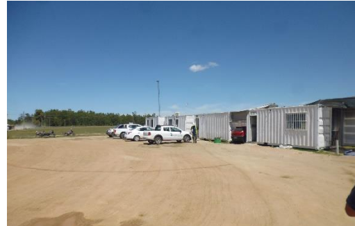
Ilustración 5 - Obrador. Ruta 23, progresiva 195K00.