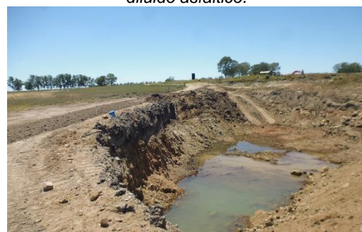
Ilustración 11 - Cantera. Padrón 178. Frente abierto.