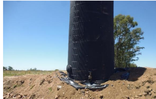
Ilustración 13 - Cantera. Padrón 178. Tanque de diluido MC.