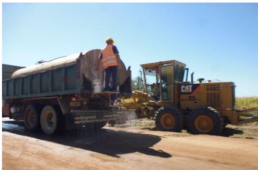
Ilustración 14 - Frente obra. Riego con agua para compactar.