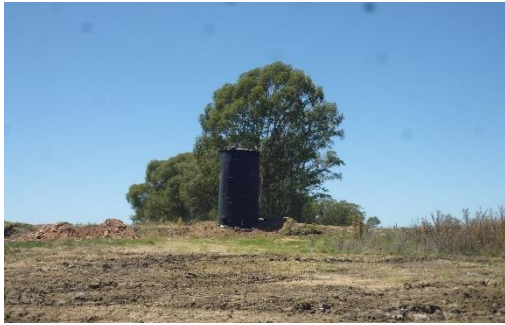
Ilustración 12 - Cantera. Padrón 178. Tanque de diluido MC..