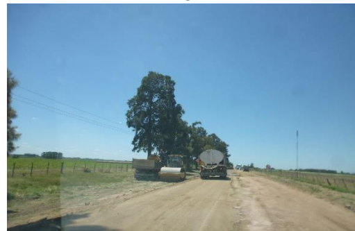
Ilustración 15 - Frente de obra. Conformación de base.