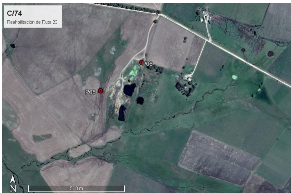
Ilustración 3 - Padrón 178. P05: nueva cantera de tosca. P06: tanque de diluido asfáltico MC.