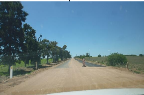
Ilustración 16 - Frente obra. Primer imprimación. Cuebierta de arena..