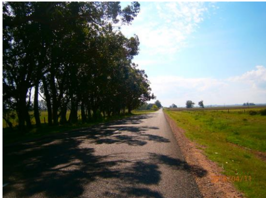
Ilustración 4 - Tramo de contrato.