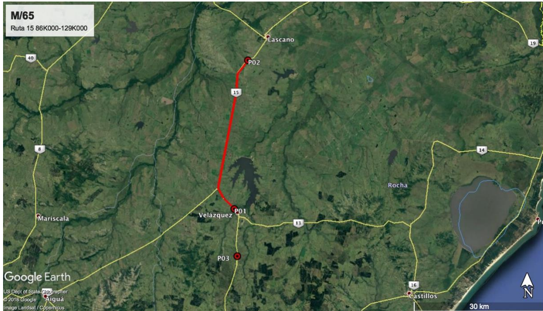
Ilustración 3 - Inicio y fin de contrato: P01 y P02. Campamento: P03.