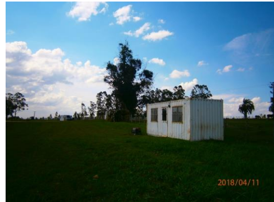
Ilustración 5 - Campamento.