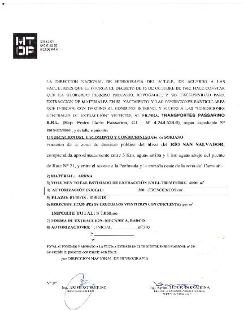
Ilustración 6 – autorización de extracción de arena.