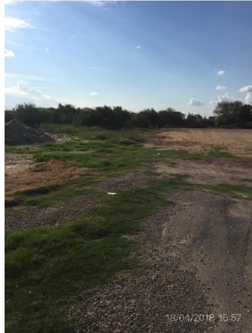
Ilustración 5 – Obrador desmontado.