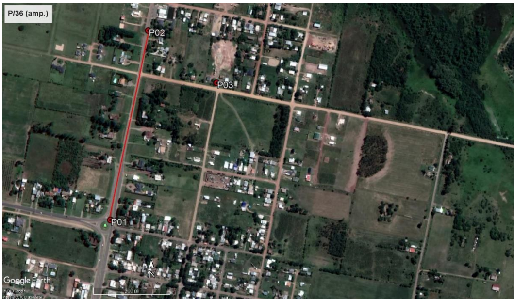
Ilustración 3 - Puntos destacados del contrato. P01 y P02 inicio y fin del contrato, P03 Obrador desmontado