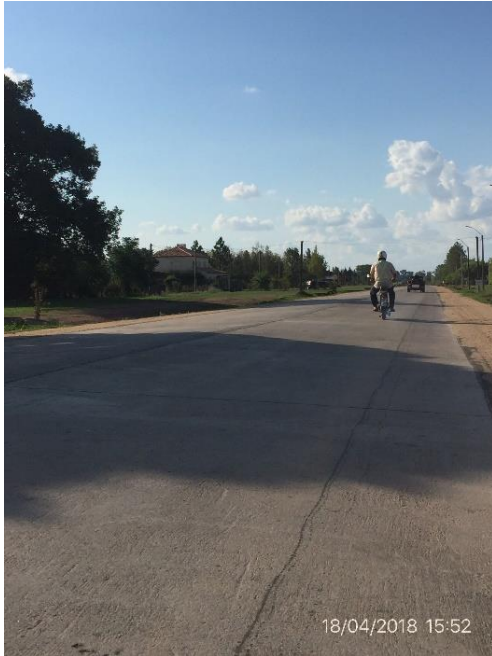
Ilustración 4 – Obra ejecutada.