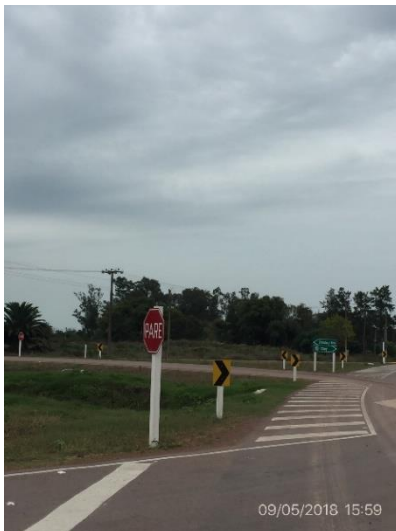
Ilustración 6 – Empalme remodelado.