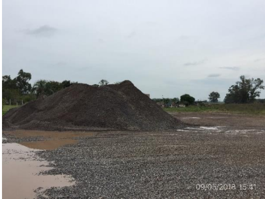
Ilustración 4 - Obrador.