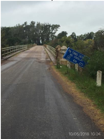
Ilustración 8 – Fin del tramo, Ruta 14 Paso Averías