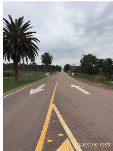
Ilustración 7 – inicio de tramo de obra culminado