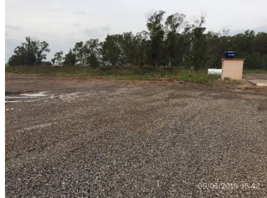
Ilustración 5 – Obrador.