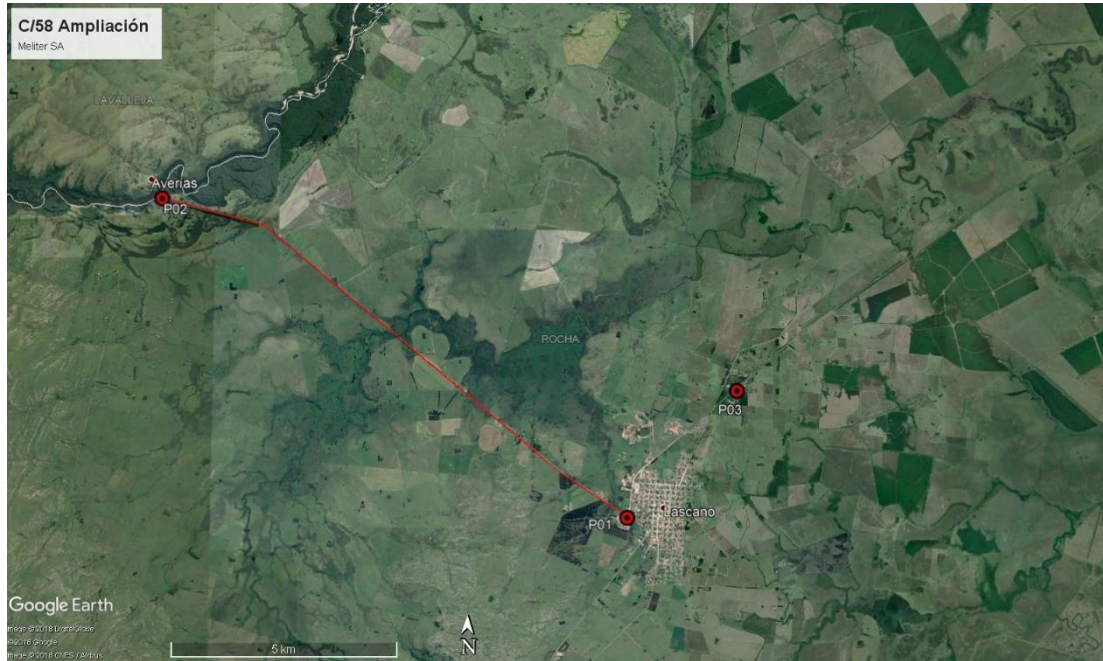
Ilustración 3 - Inicio y fin: P01, P02. Obrador: P03.