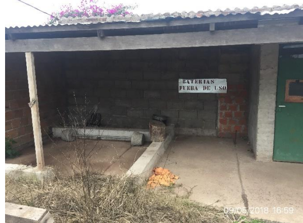
Ilustración 7 – Obrador desmontado, localidad San Luis al Medio