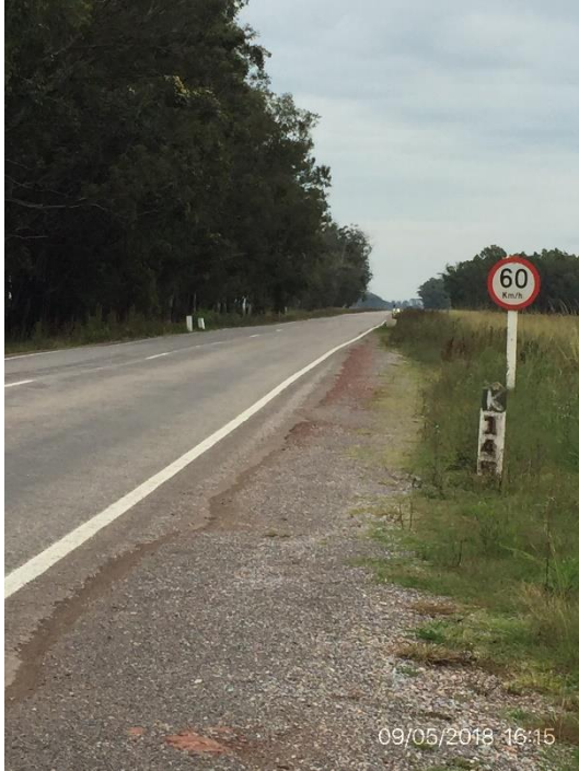
Ilustración 4 – Tramo ejecutado.