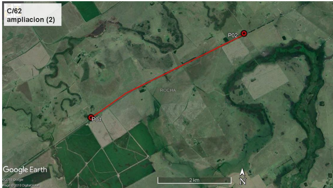
Ilustración 3 - Inicio y fin: P01, P02. Obrador: P03.