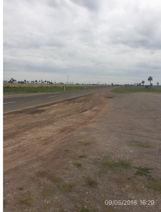
Ilustración 5 – Sitio recuperado de acopio de materiales en faja, Ruta 15 progresiva 150K000