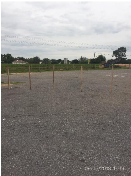
Ilustración 6 – Obrador desmontado, localidad San Luis al Medio.