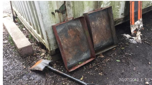
Ilustración 11 - Obrador: bandejas para retención de derrames en trasiego de hidrocarburos