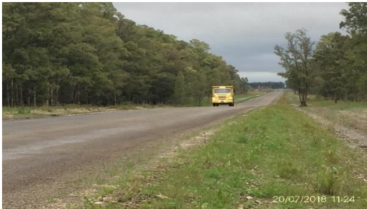
Ilustración 6 - Tramo de obra; faja acondicionada