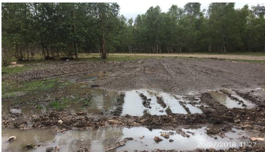
Ilustración 8 - Sector desmontado de acopio de diluido asfáltico.