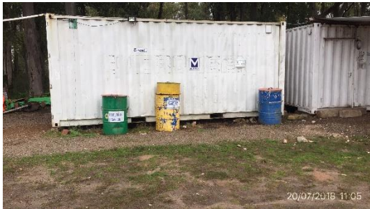
Ilustración 10 – Obrador: segregación de residuos.