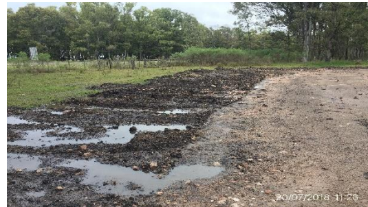
Ilustración 7 – Sector desmontado de acopio de diluido asfáltico