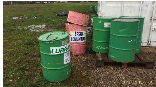
Ilustración 13 - Obrador: acopio de lubricantes.