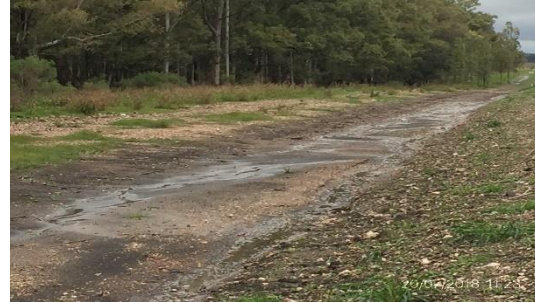
Ilustración 5 – Tramo de obra; faja acondicionada