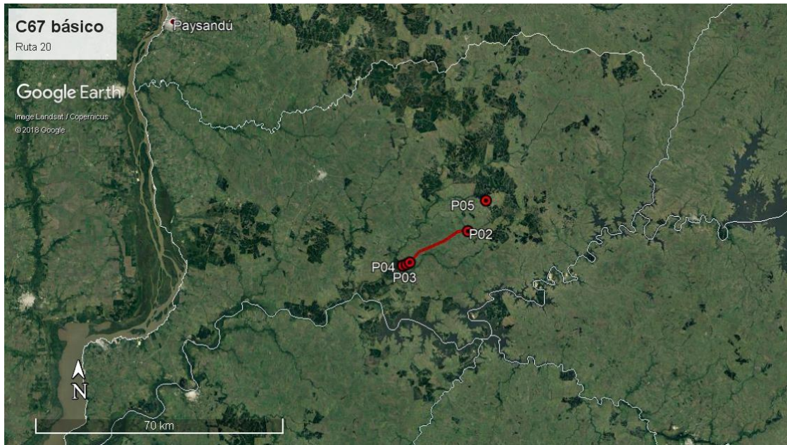
Ilustración 2 - Ubicación del contrato a nivel departamental