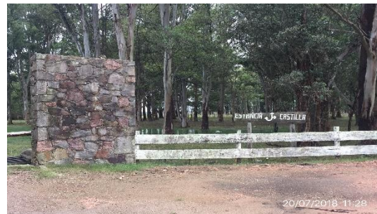
Ilustración 9 - Sector desmontado de acopio de diluido asfáltico