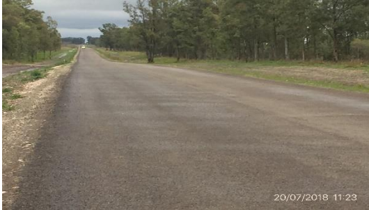
Ilustración 4 – Tramo de obra terminado