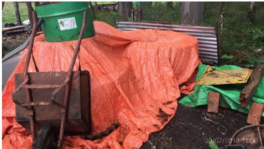
Ilustración 12 – Obrador: acopio de neumáticos