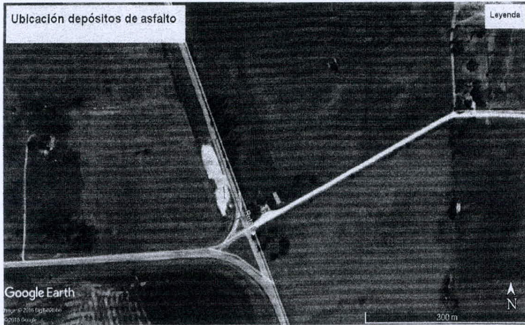
Ubicación propuesta para depósitos de asfalto y acopio de materiales: Intersección de Ruta 12 y Ruta 6 (Florida)

Ruta 48 km 18.900 Canelones -- Tel: 2365 1300 - 2364 0770