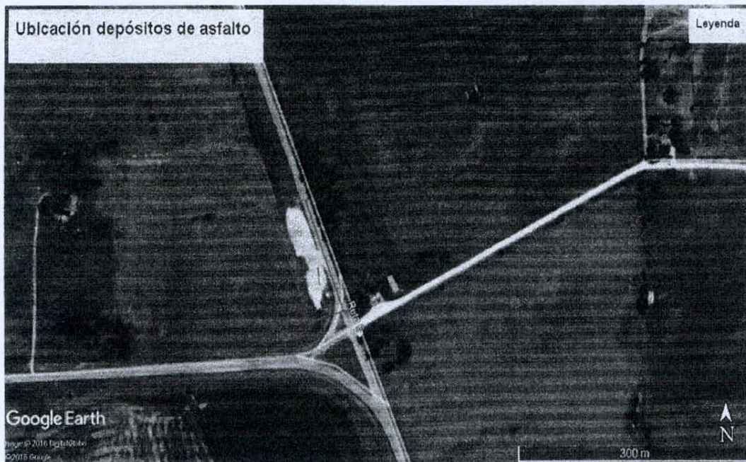
Ubicación propuesta para depósitos de asfalto y acopio de materiales: Intersección de Ruta 12 y Ruta 6 (Florida)

Ruta 48 km 18.900 Canelones – Tel: 2365 1300 - 2364 0770