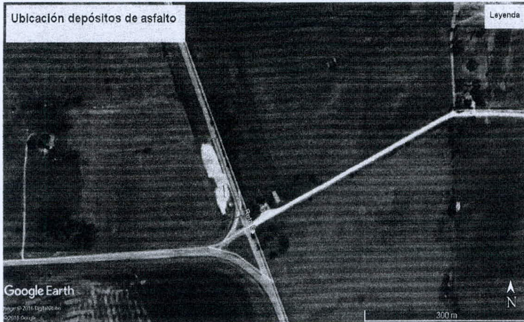
Ubicación propuesta para depósitos de asfalto y acopio de materiales: Intersección de Ruta 12 y Ruta 6 (Florida)

Ruta 48 km 18.900 Canelones – Tel: 2365 1300 - 2364 0770