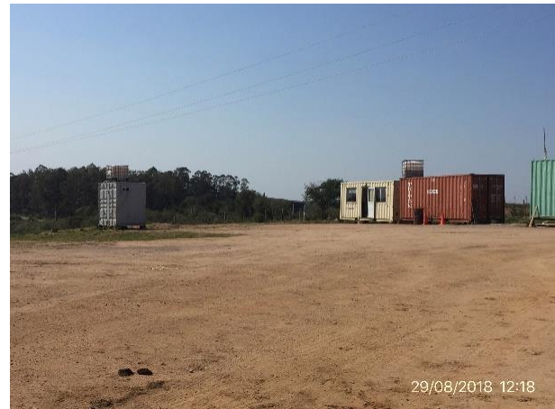
Ilustración 7 - Obrador Desmontado