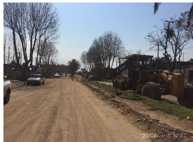
Ilustración 9 – Frente de obras en ciudad de Velázquez.