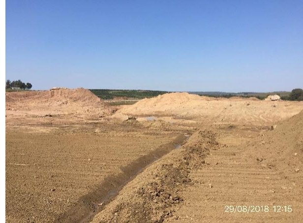
Ilustración 5 - Cantera de tosca.