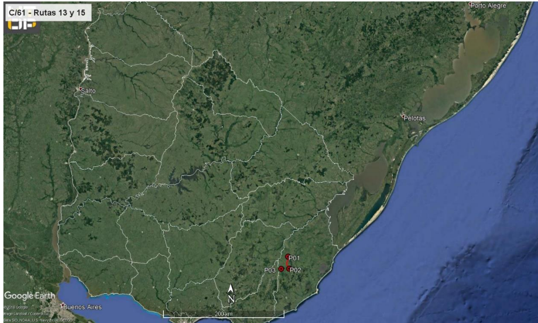
Ilustración 1 - Ubicación del contrato a nivel Nacional

Para este contrato, la empresa Molinsur SA explotó la cantera de tosca en el Padrón Rural N° 327 de Rocha. La empresa nos presentó la AAP con fecha 08/03/2017 y un plazo de 2 años. La AAP permite la extracción hasta 90.000 m 3 y un área de 3,8 ha.