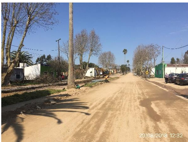
Ilustración 8 – Frente de obras en ciudad de Velázquez.