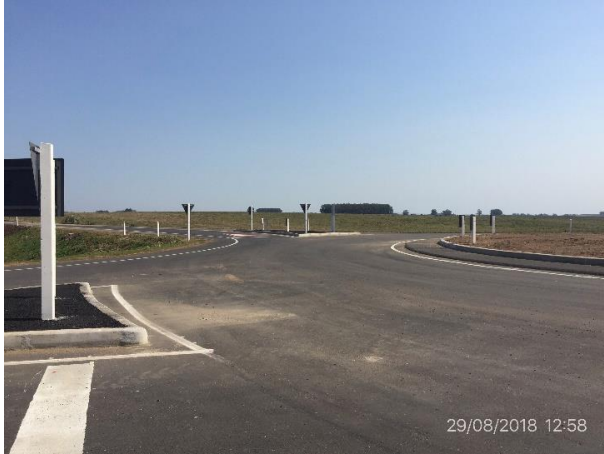
Ilustración 10 – Tramo de obra culminado, empalme de Ruta 13 y Ruta 15..