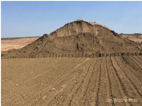
Ilustración 6 - Cantera de tosca.