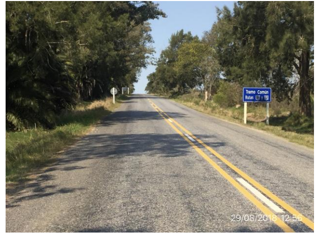
Ilustración 11 – Tramo de Ruta 13 y Ruta 15 en común, culminado.