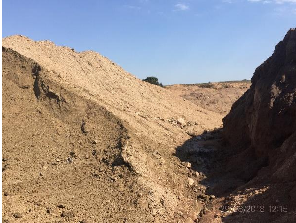
Ilustración 4 – Cantera de tosca