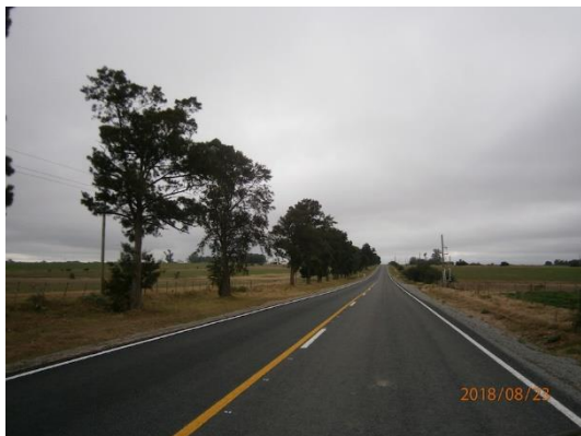
Ilustración 6 - frente de obra.