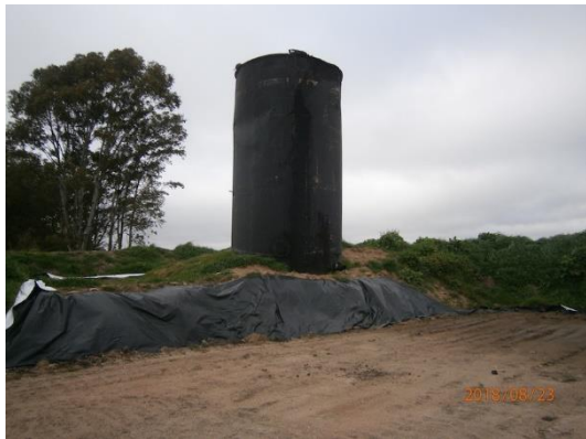
Ilustración 4 - tanque de diluido asfáltico.