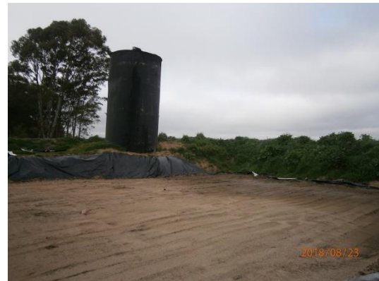
Ilustración 5 - tanque de diluido asfáltico.