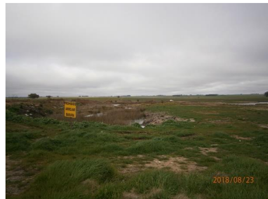
Ilustración 7 - cantera de tosca.