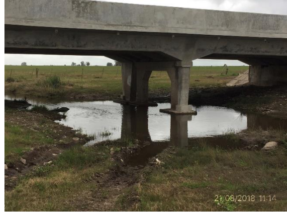
Ilustración 17 - P02 Puente sobre Cda La Zorra.