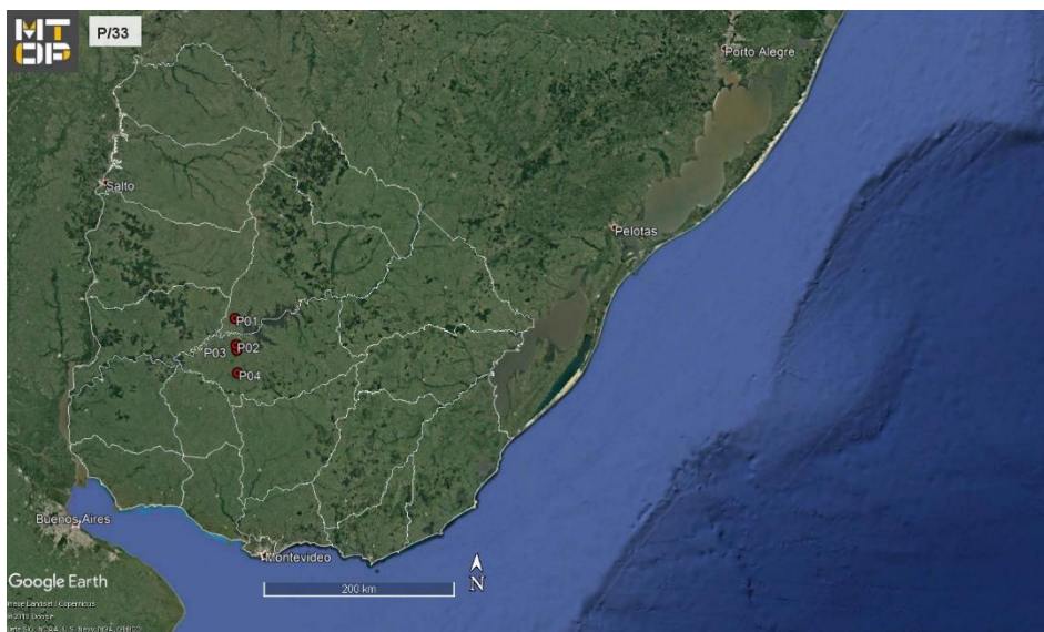
Ilustración 1 - Ubicación del contrato a nivel nacional