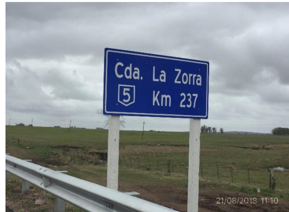
Ilustración 15 - P02 Puente sobre Cda La Zorra.