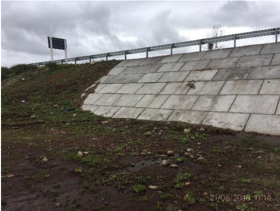
Ilustración 18 - P02 Puente sobre Cda La Zorra, cabecera empastada