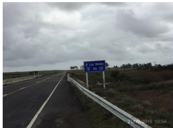
Ilustración 9 – P03 Puente sobre A° Los Molles