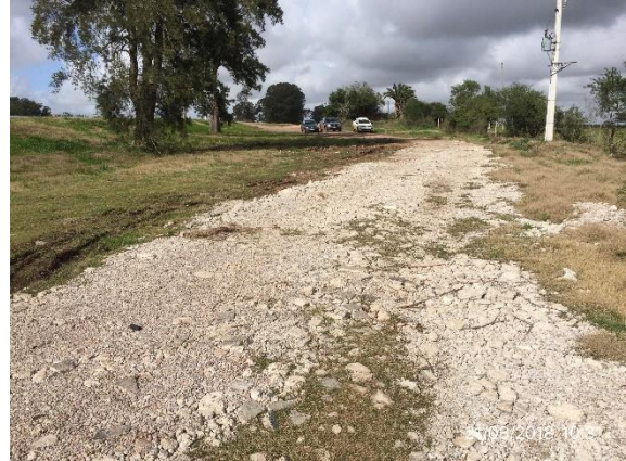
Ilustración 5 - P04 Obrador desmontado en Puente sobre A° Villasboas