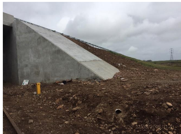
Ilustración 21 - P01 Puente sobre vía férrea, progresiva 266K000