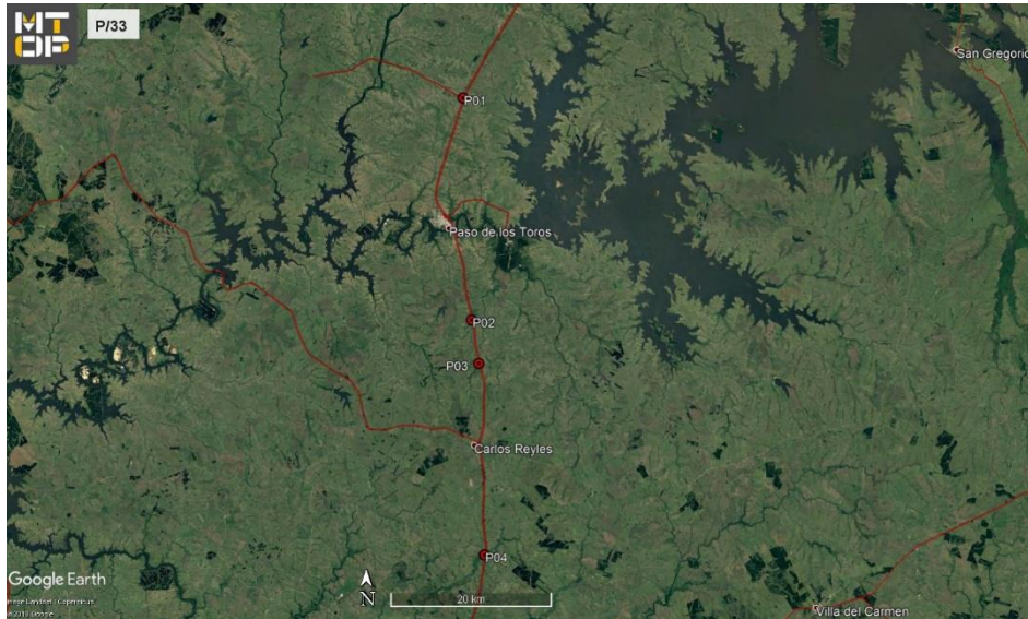
Ilustración 3 - ubicación de los cuatro puentes auditados: P01 - Puente sobre pasaje ferroviario; P02 - Puente sobre cañada La Zorra; P03 - Puente sobre arroyo Molles; P04 - Puente sobre arroyo Villasboas