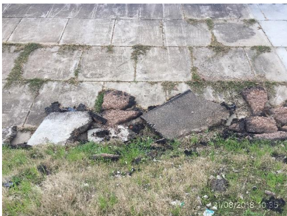
Ilustración 8 – P04 Puente sobre A° Villasboas, escombros sin remover