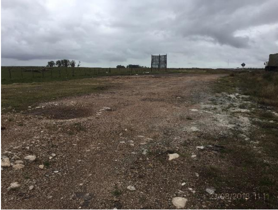
Ilustración 16 - P02 Puente sobre Cda La Zorra.