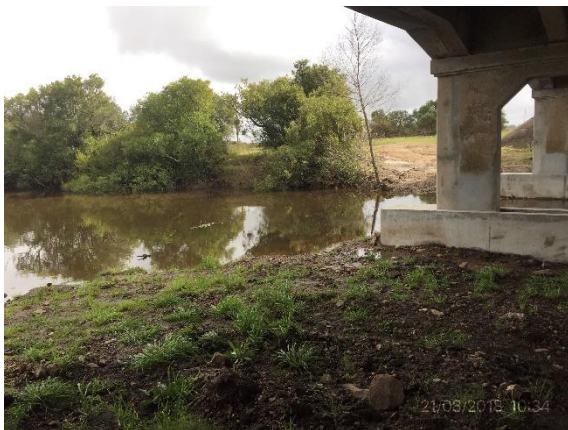
Ilustración 6 – P04 Puente sobre A° Villasboas