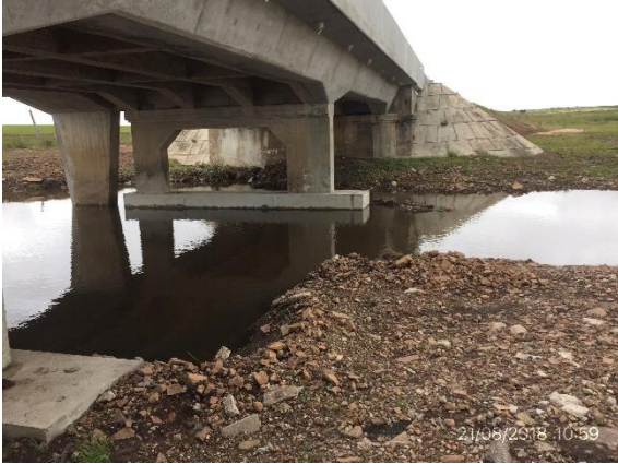
Ilustración 10 – P03 Puente sobre A° Los Molles. Ataguía provisoria parcialmente sin remover