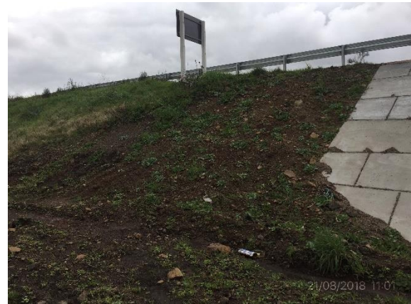
Ilustración 13 - P03 Puente sobre A° Los Molles. Recuperación y empastado de cabeceras