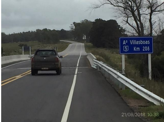
Ilustración 4 – P04 Puente sobre A° Villasboas