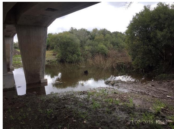
Ilustración 7 – P04 Puente sobre A° Villasboas