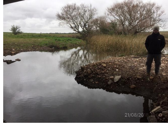
Ilustración 11 - P03 Puente sobre A° Los Molles. Ataguía provisoria parcialmente sin remover