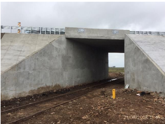
Ilustración 20 - P01 Puente sobre vía férrea, progresiva 266K000