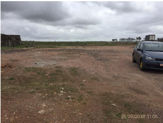
Ilustración 14 - P02 Puente sobre Cda La Zorra. Obrador desmontado y zona recuperada.