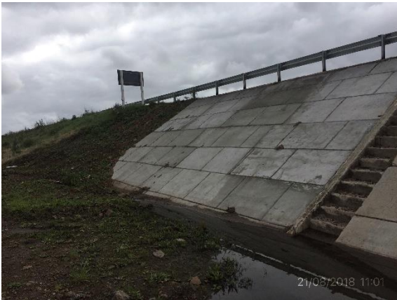
Ilustración 12 - P03 Puente sobre A° Los Molles. Recuperación y empastado de cabeceras