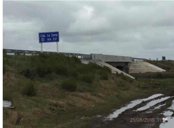
Ilustración 19 - P02 Puente sobre Cda La Zorra, cabecera empastada