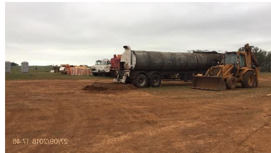
Ilustración 7 – Campamento desmontado con maquinaria estacionada.