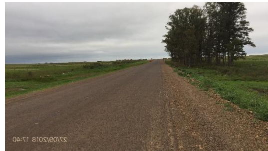
Ilustración 5 – Tramo de ruta construido.