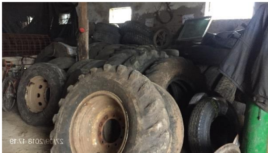
Ilustración 4 – P03 - Obrador Secundario, Biassini.