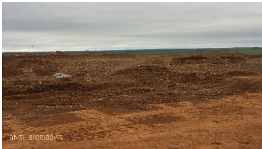
Ilustración 6 – Cantera en explotación.