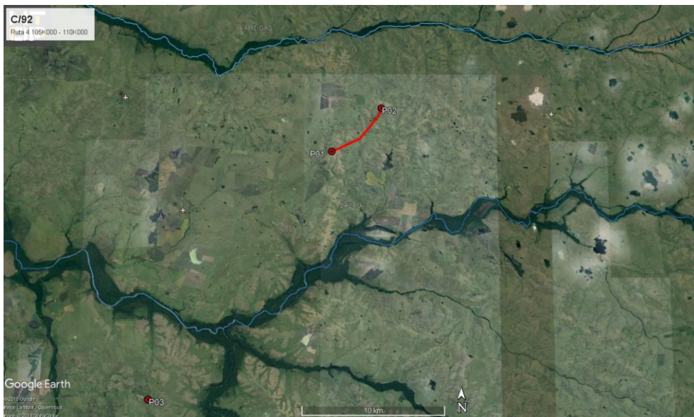
Ilustración 3 - P01 y P02, inicio y fin del contrato. P03: Obrador secundario, Biassini (Salto)