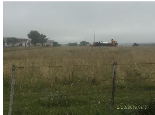
Ilustración 7 – Estacionamiento de maquinaria