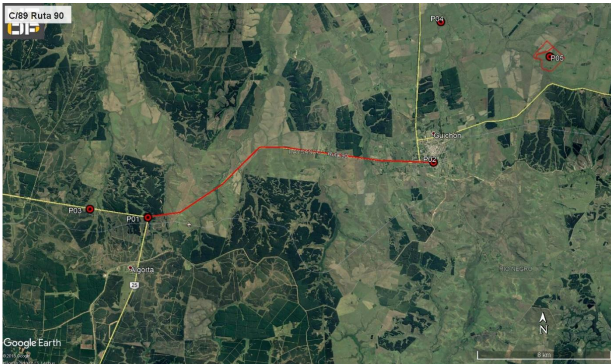
Ilustración 3 - P01 y P02, inicio y fin del contrato. P03: Cantera: P04: Campamento provisorio