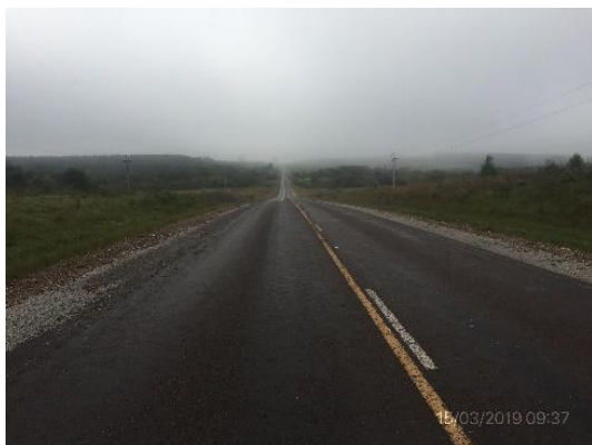
Ilustración 8 – Tramo ejecutado