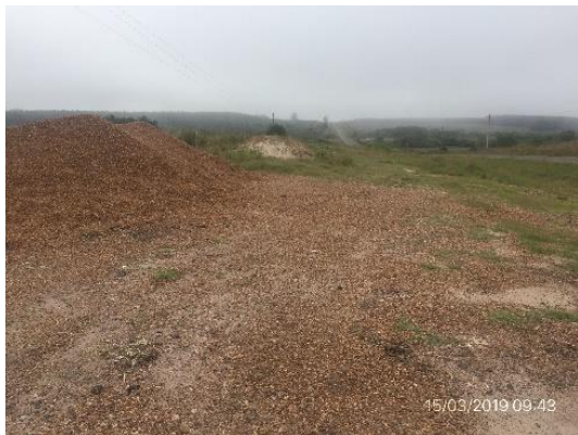
Ilustración 6 – Campamento desmontado, Ruta 90 progresiva 67K000 a (-)