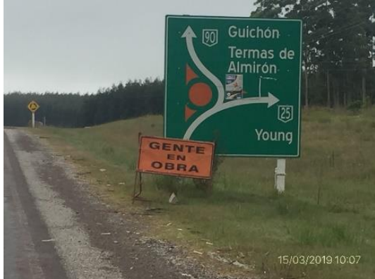
Ilustración 4 – Inicio de tramo, empalme de Rutas 90 y 25