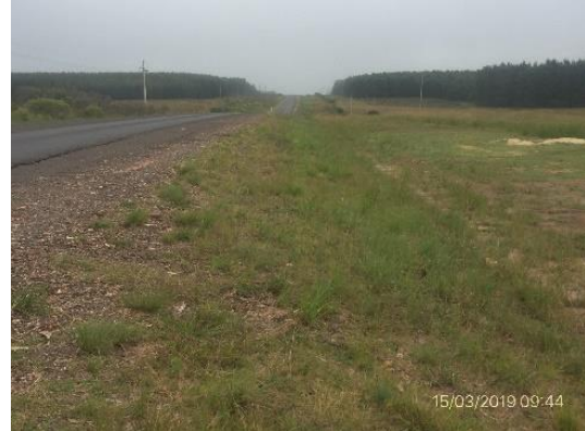
Ilustración 5 – Tramo ejecutado, empastado de banquetas adecuado al PRA