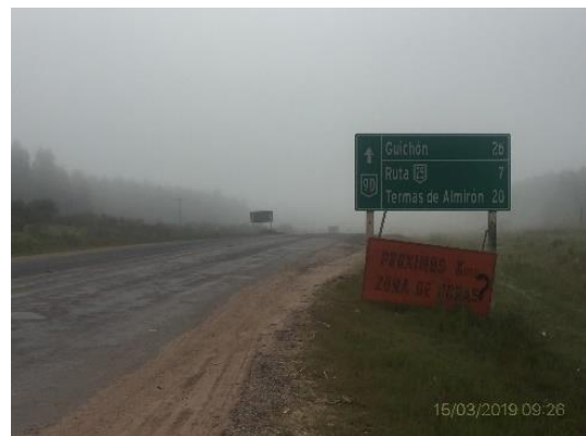
Ilustración 9 – Fin de tramo.