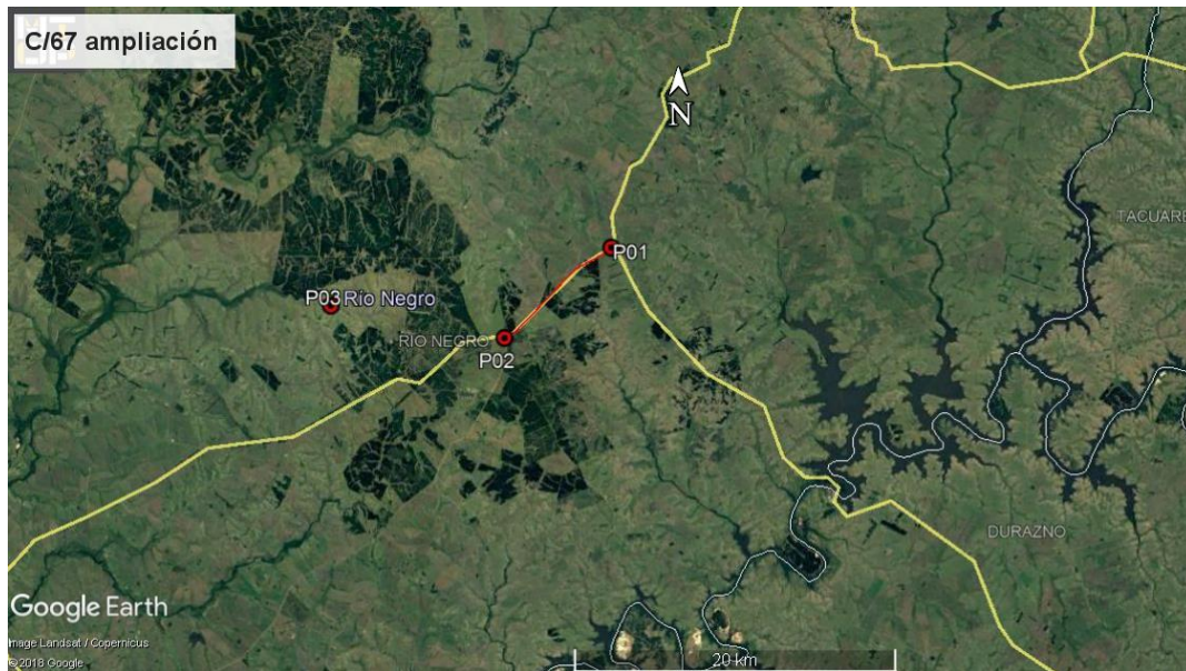
Ilustración 3 - Tramo auditado. Inicio y fin de obras: P01 y P02, Obrador principal: P03, Canteras: P04 y P05.