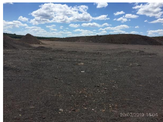
Ilustración 9 - Cantera cerrada, padrón 6001