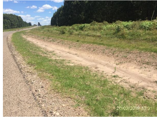
Ilustración 5 - Tramo de Ruta 20, recuperación de faja pública