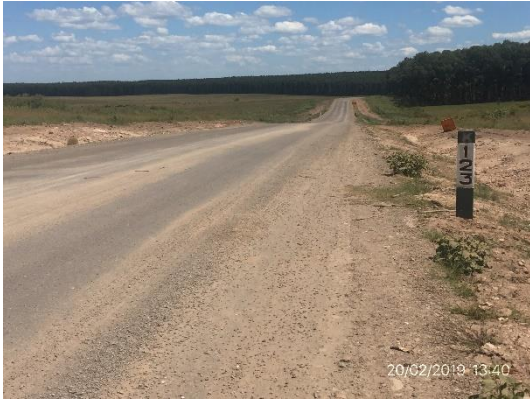
Ilustración 4 - Frente de obra – Fin de tramo progresiva 123K600 empalme con Ruta 4