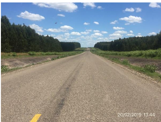
Ilustración 8 – Tramo de obra ejecutado.