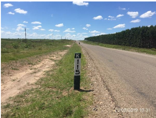
Ilustración 6 – Frente de obra – Inicio de tramo progresiva 115K000 Ruta 20, entrada a Pueblo Grecco