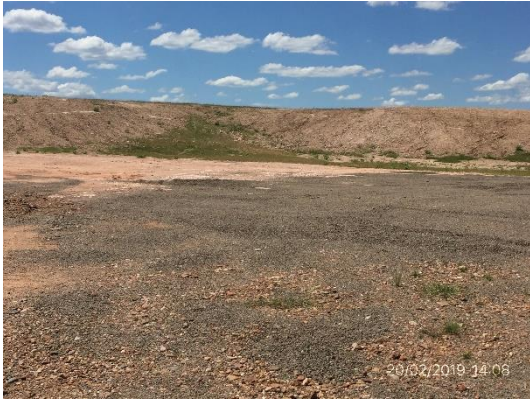
Ilustración 10 - Cantera cerrada, padrón 6001.