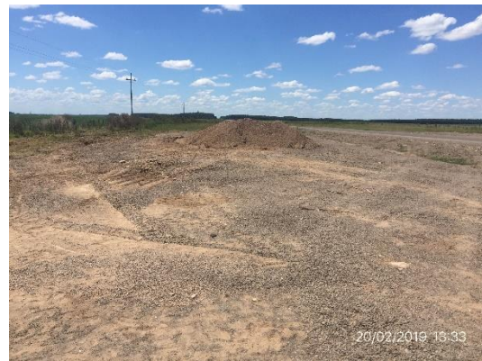
Ilustración 7 – Ruta 20 progresiva 116K000. Acopio de material granular autorizado por DDO.