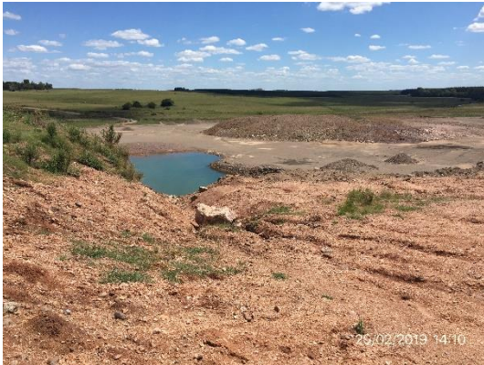
Ilustración 12 - Cantera cerrada, padrón 6001.