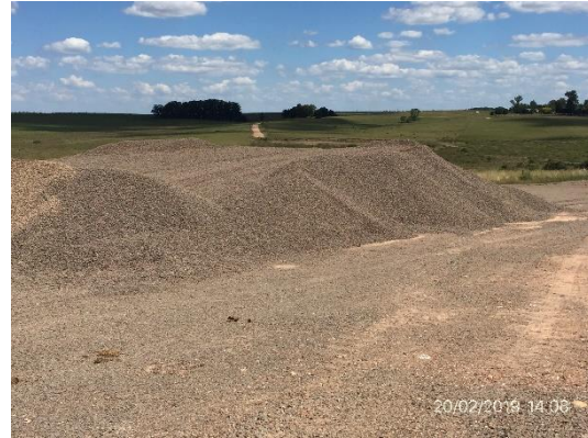
Ilustración 11 - Cantera cerrada, padrón 6001. Acopios de material granular para trabajos de mantenimiento